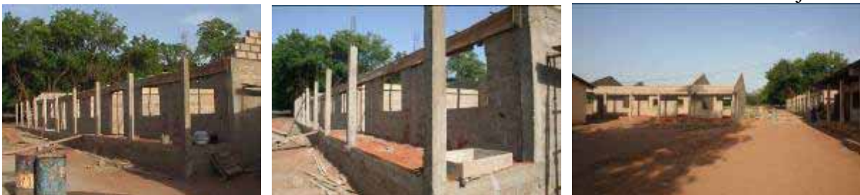
Y una vista de los dos juntos:

Pudimos, además, ver a chicas y chicos colaborando en las obras, al acabar sus clases: