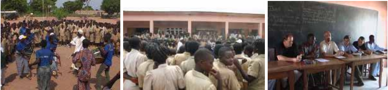
Inauguración de la Escuela de Kalalé:

VIAJE A BENIN: Una vez más, en el mes de mayo he tenido la oportunidad de recorrer el norte de Benin. Hemos inaugurado las 3 Escuelas financiadas y hemos visitado las obras en curso y las aulas informáticas que se van estructurando con los ordenadores enviados a finales del año pasado. Damos un repaso en imágenes, comenzando por la inauguración de la Escuela de Bouka: