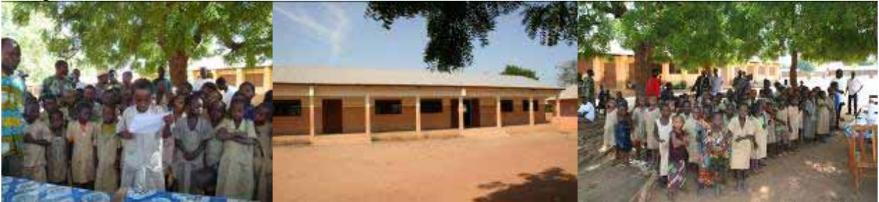
Inauguración de la Escuela de Weé weé: