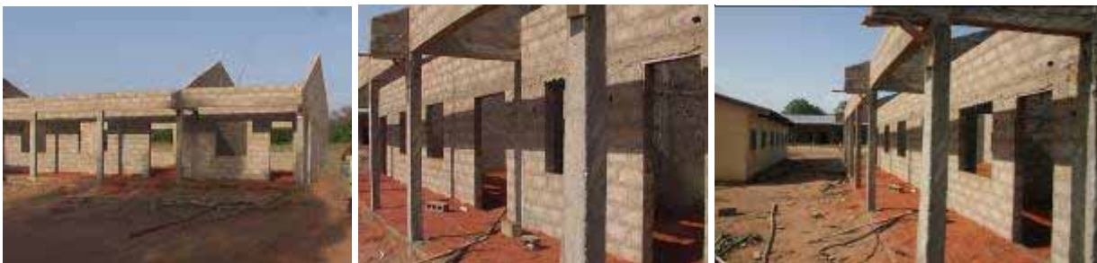
Este es el de las aulas:

CENTRO DE SECUNDARIA DE KALALÉ: Recordáis que gracias a la Campaña De Navidad, conseguimos financiar para La Región de Kalalé un Instituto de Secundaria con el preceptivo laboratorio, imprescindible para alcanzar la titulación. Hoy simplemente actualizo de una manera gráfica el estado de las obras al mes de mayo 2009. ¡Tres meses después de iniciar el envío de fondos! Va más avanzado el edificio del Laboratorio: